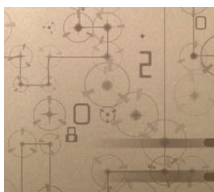
ZERO 03F004 Gold