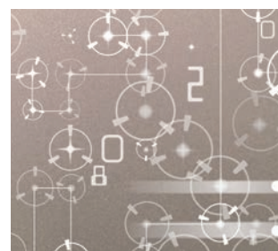
ZERO 03F002 Titan