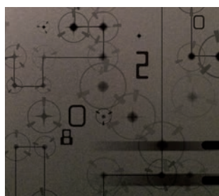
ZERO 03F005 Carbon