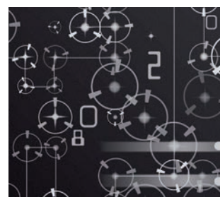
ZERO 03F008 Black