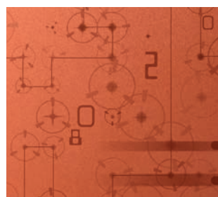
ZERO 03F003 Copper