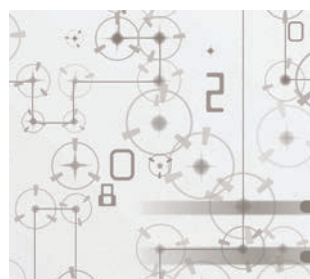
ZERO 03F007 White