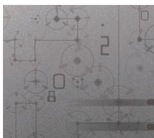
ZERO 03F001 Alu